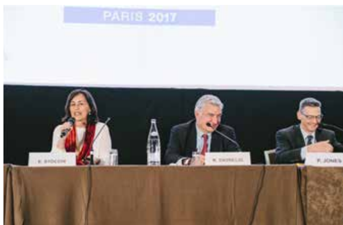
LA SESSIONE CONGIUNTA ASECAP-IBTTA SUL PEDAGGIO IN EUROPA E IN NORD AMERICA.