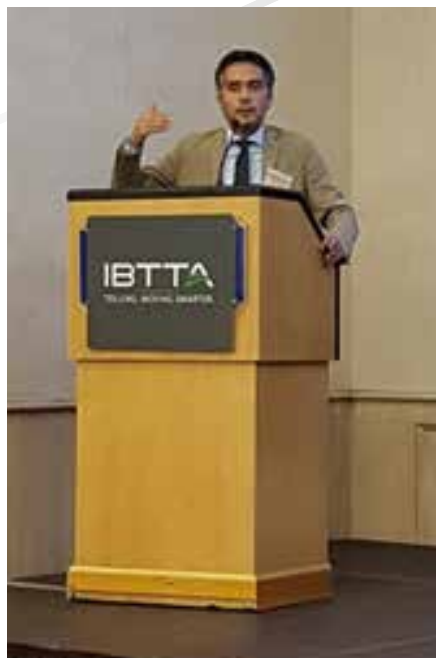
L'ONOREVOLE MASSIMILIANO SALINI DEL PARLAMENTO EUROPEO

Nello spirito di internazionalità che ha caratterizzato il 2017 e l'evento di Roma in particolare, le tematiche trattate hanno anche stimolato un interessante livello di dibattito tra i partecipanti dei venti Paesi presenti