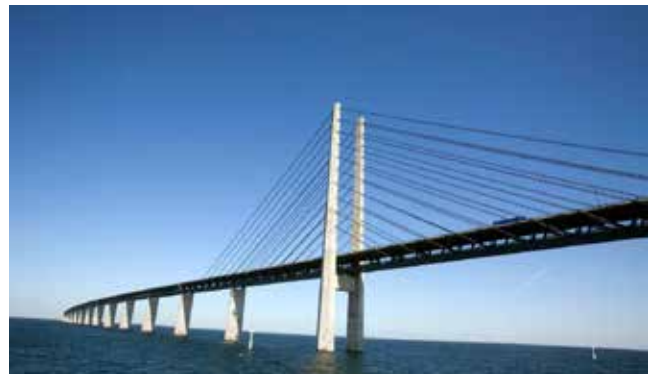
LA STAZIONE DI PEDAGGIO A SX E A DX UNA PANORAMICA DEL PONTE ØRESUND CHE COLLEGA COPENHAGEN A MALMO.