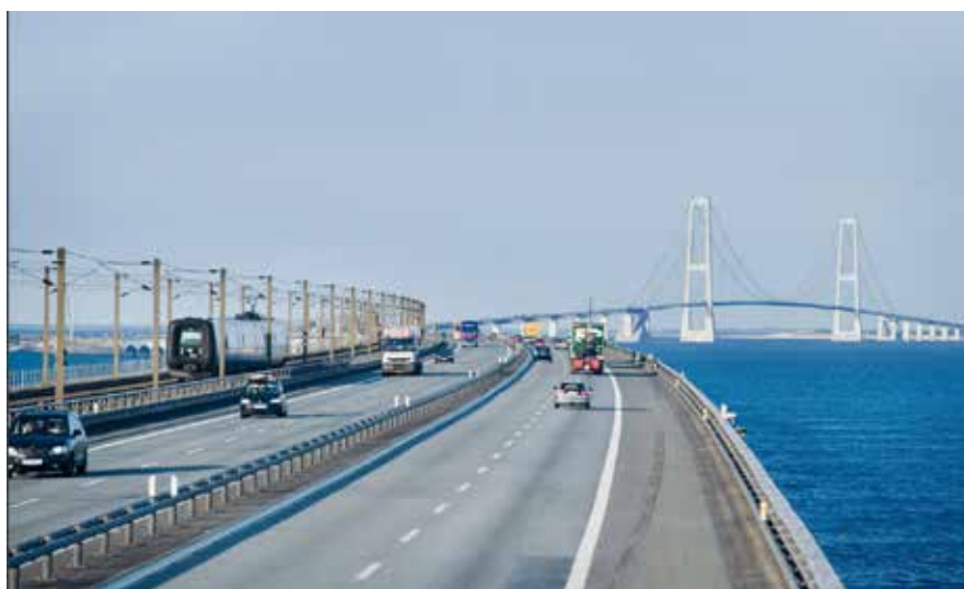
UNA PANORAMICA DEL PONTE STOREBAELT.

La seconda sessione è stata invece focalizzata sulle aree di servizio e su come in Austria, Danimarca e Portogallo si stiano portando avanti dei nuovi modelli di partnership e di gestione delle aree di servizio che possano meglio